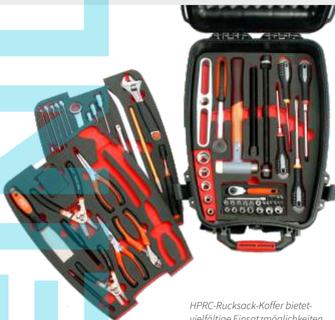
HPRC-Rucksack-Koffer bietet vielfältige Einsatzmöglichkeiten