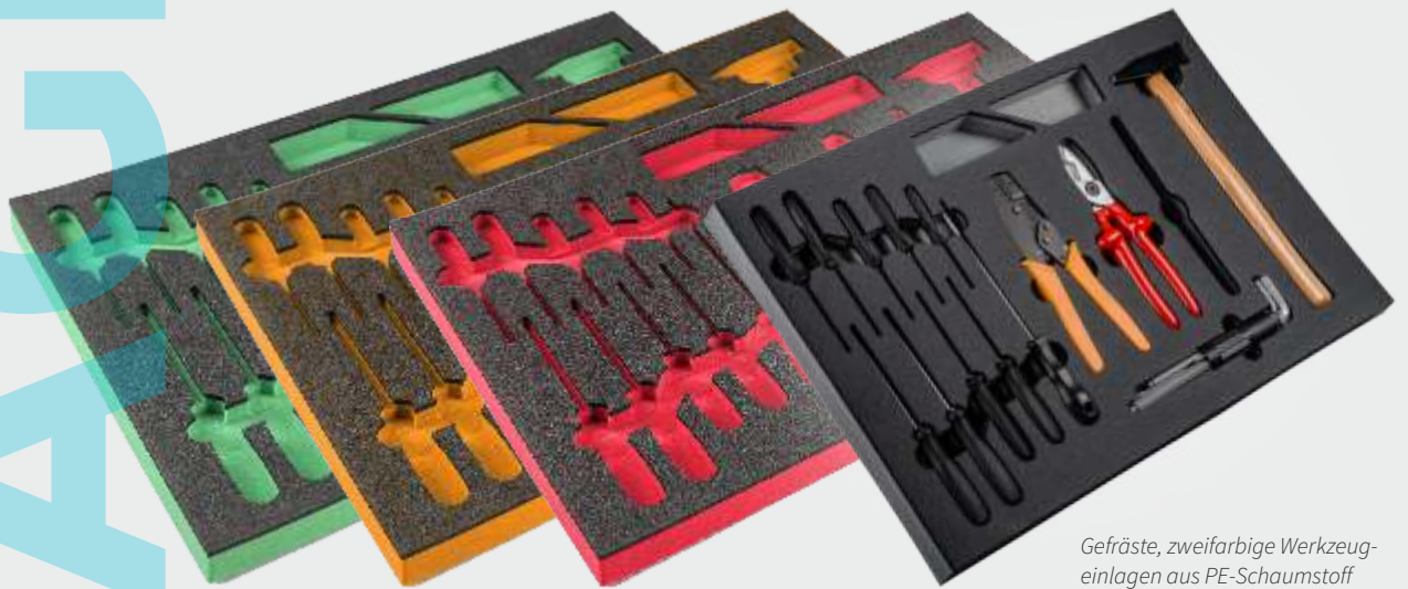
Gefräste, zweifarbige Werkzeugeinlagen aus PE-Schaumstoff

Wählen Sie unter zahlreichen Schaumstofftypen - für jede Anforderung gibt es das richtige Produkt. Unsere CNC-gesteuerten Maschinen fräsen eine extrem präzise Kontur aus dem Schaumstoffrohling heraus - alles bleibt fest am vorgesehenen Platz. Ihr Produkt wird attraktiv präsentiert und sicher transportiert.