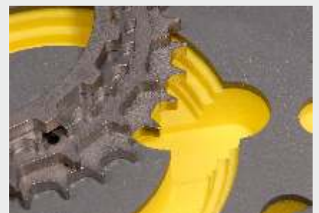
Passgenaue PE-Schaumstoffeinlagen - hier bleibt alles an Ort und Stelle!