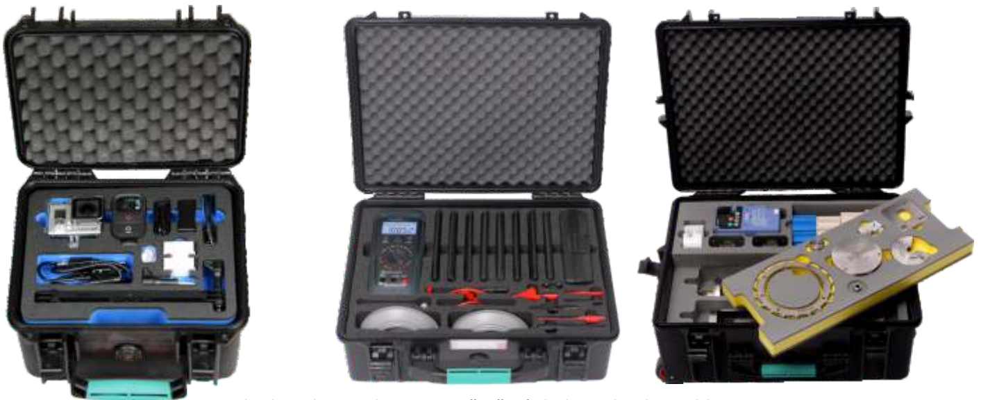
Mehrteilige Einlagen in robusten Kunststoff-Koffern für höchsten Schutz Ihrer Produkte

Kombinieren Sie den HPRC-Koffer mit einer optimal angepassten Schaumstoffeinlage - so schaffen Sie die perfekte Transportmöglichkeit für Ihre Ausrüstung.