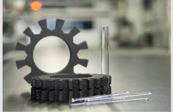
Konturgeschnittene Schaumstoff-Teile für Anwendungen in der Labormedizin