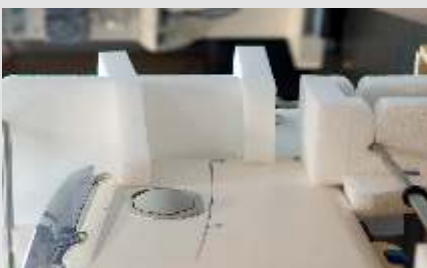
Passgenaue PE-Schaumstoffeinlagen - hier bleibt alles an Ort und Stelle!