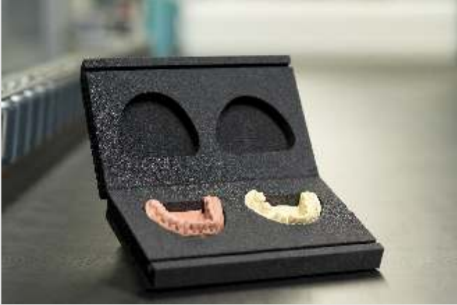
Schaumstoff-Etui für Anwendungen in der Zahnmedizin