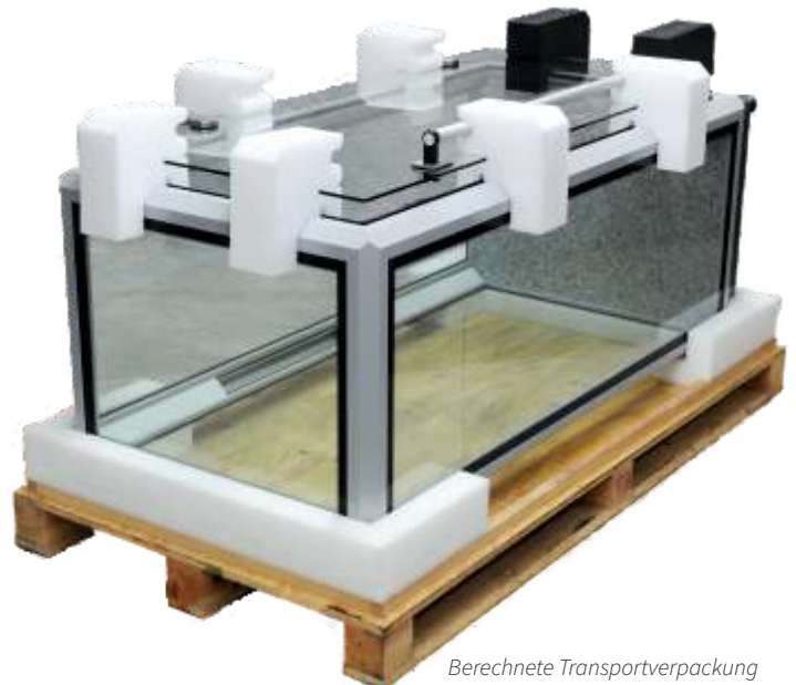
Berechnete Transportverpackung einer Sauerstoffkabine